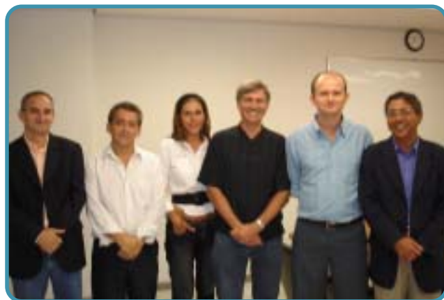
Os novos membros do Conselho no dia da posse acompanhados da diretoria da Fundação

A votação via Internet foi a forma mais utilizada: 961 votos eletrônicos contra 445 via Correios, mostrando que, cada vez mais, o participante tem tirado partido do computador para facilitar a comunicação com a Fundação Banestes.